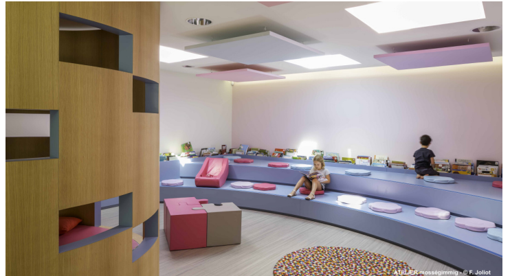
ATELIER moss&gimmig - © F. Joliot