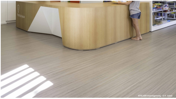
ATELIER moss&gimmig