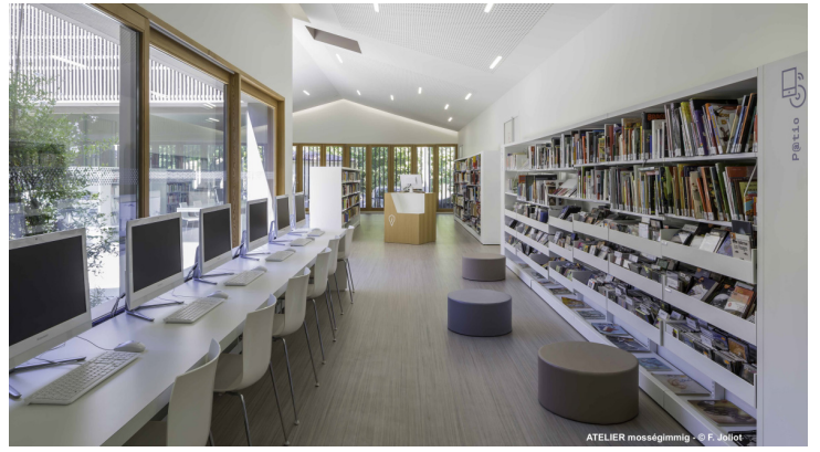
ATELIER moss&gimmig - © F. Joliot