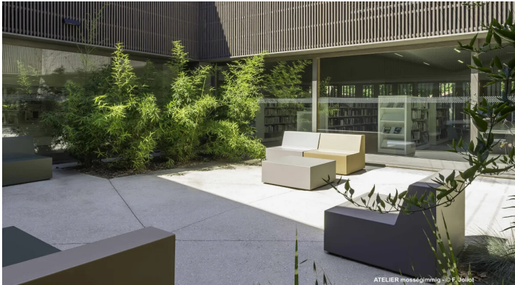
ATELIER moss&gimmig - © F. Joliot